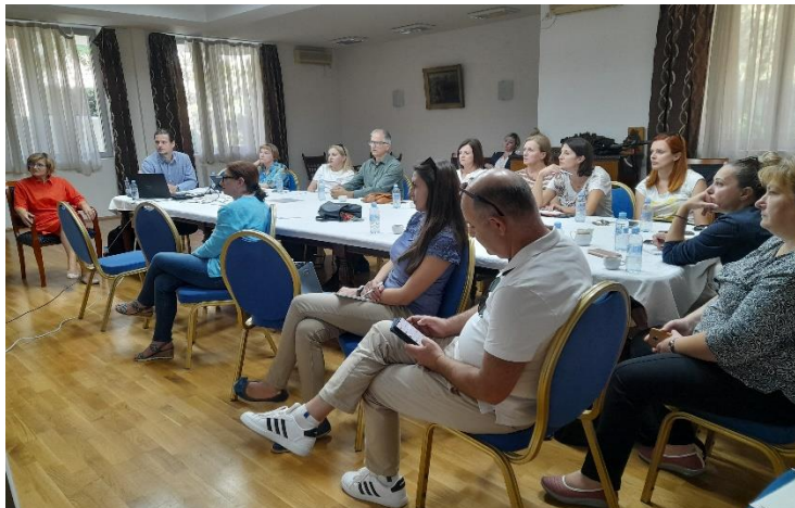
Fotografitë: Punëtoritë për përdorimin dhe mirëmbajtjen e regjistrit dixhital të KKK-së

Si rezultat i këtij misioni, u përgatiten edhe dy uebinarë dhe udhëzime për përdorimin dhe mirëmbajtjen e regjistrit dixhital të KKK-së.