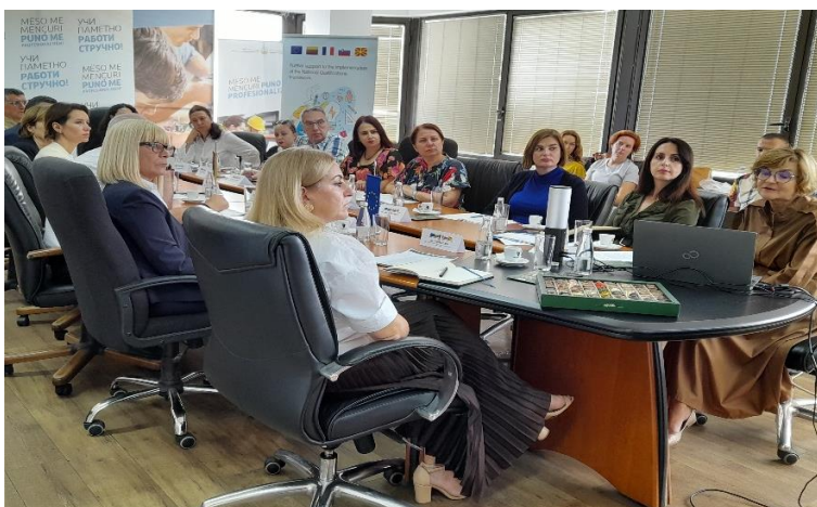
Fotografitë: Takimi i tetë i Bordit Administrativ të Projektit të mbajtur më 19 shtator

Në prag të përfundimit të projektit, periudha e fundit e planifikimit parashikon 29 misione të cilat duhet t'i realizojnë ekspertë të vendeve anëtare, të sistemuara në kuadër të shtatë aktivitete të projektit. Krahas kësaj, do të organizohet edhe ngjarje për përmbylljen e projektit për të shënuar përfundimin e suksesshëm të projektit. Mbledhja e Bordit Drejtues përfundoi me miratimin formal të raportit të shtatë tremujor dhe periudhës së ardhshme të planifikimit.